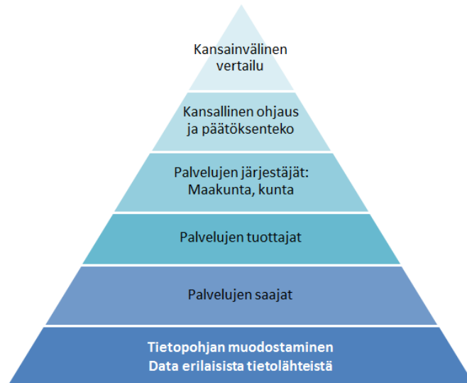
Kuvio 2. Yhteinen tietopohja mahdollistaa tiedon käytön päätöksenteon eri tasolla ja eri tarkoituksiin. (Mukailtu: https://verkkojulkaisut.valtioneuvosto.fi/stm/zine/16/toc )