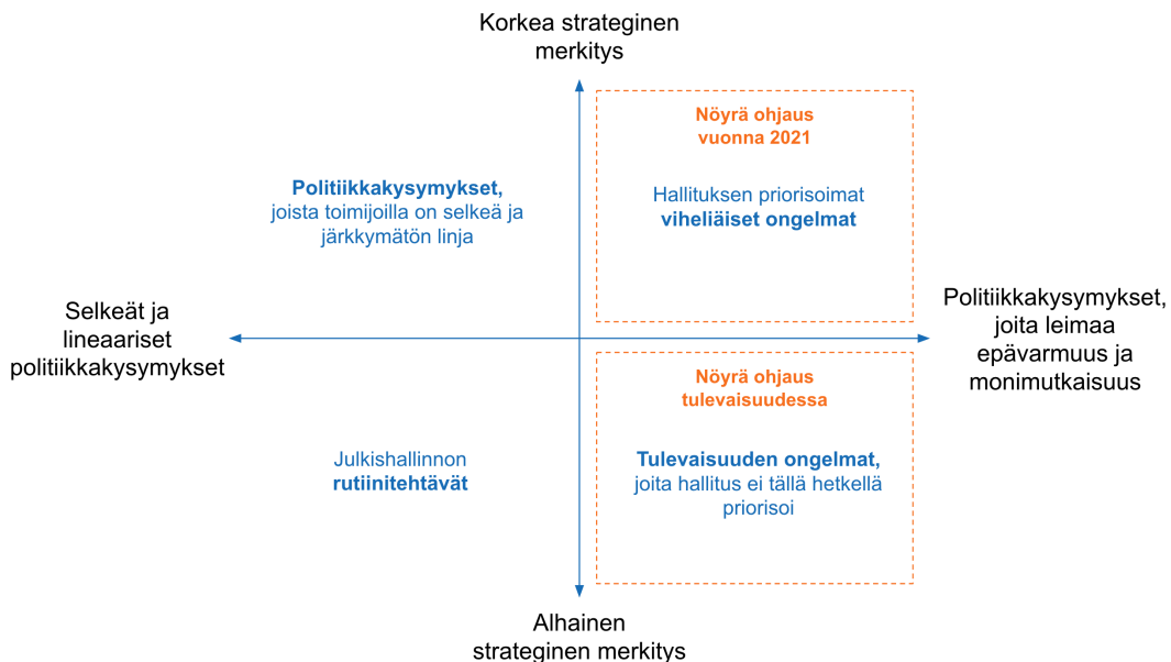
Kuva 2: Viitekehys sen arvioimiseksi, milloin nöyrää ohjausta voidaan hyödyntää Suomen kontekstissa.

Nöyrän ohjauksen tärkein edellytys on perustava konsensus yhteisestä suunnasta, jota eri toimijat sitoutuvat edistämään, vaikka keinot tavoitteiden saavuttamiseksi jätetään auki. On selvää, että tiettyjen politiikkakysymysten kohdalla aatteelliset erot ja eturistiriidat tekevät perustavan konsensuksen luomisesta mahdotonta. Ensinnäkin nöyrä ohjaus soveltuu siksi vain niihin strategisesti tärkeisiin yhteiskunnallisiin haasteisiin, joiden ratkaisemiseen hallitus on valmis käyttämään poliittista pääomaa tekemällä merkittäviä kompromisseja. Toiseksi, nöyrää ongelmanratkaisua voidaan soveltaa vain silloin, kun ongelmanratkaisua määrittää epävarmuus ja kompleksisuus — jos päätöksentekijöillä on varmuus siitä, miten tietty ongelma tulee ratkaista, ei nöyrälle ongelmanratkaisuprosessille nähdä tarvetta.