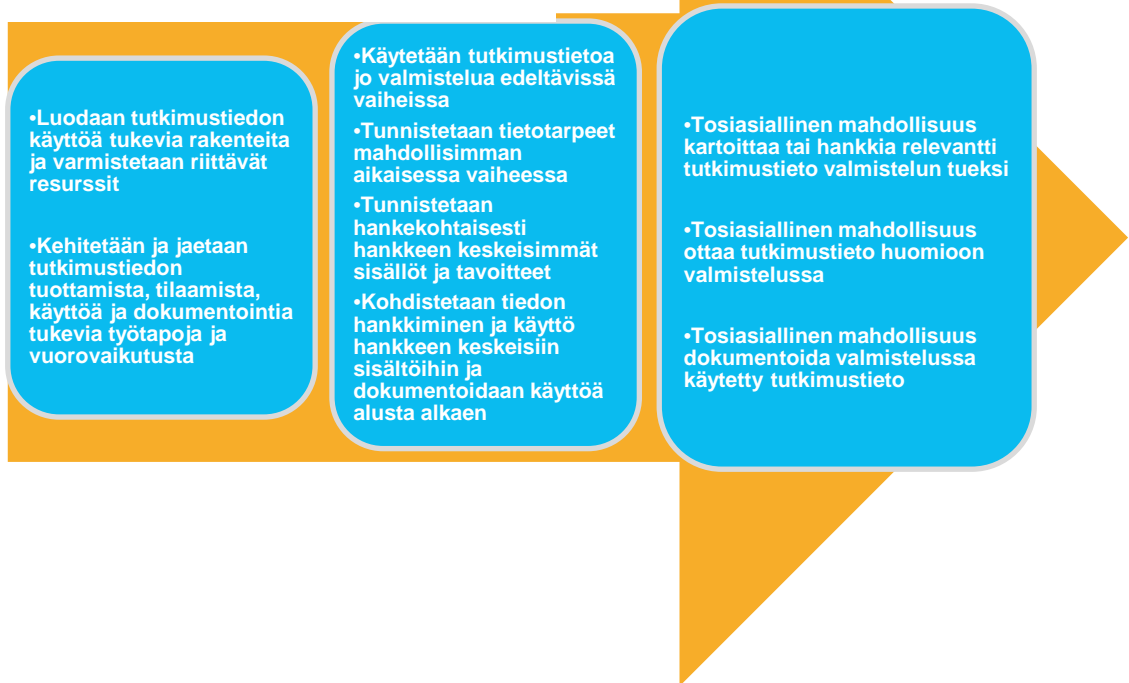
Kuvio 1. Yhteenveto suosituksista